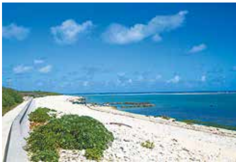
石垣島の白保海岸。沖には北半球最大のアオサコ群集が広がる。