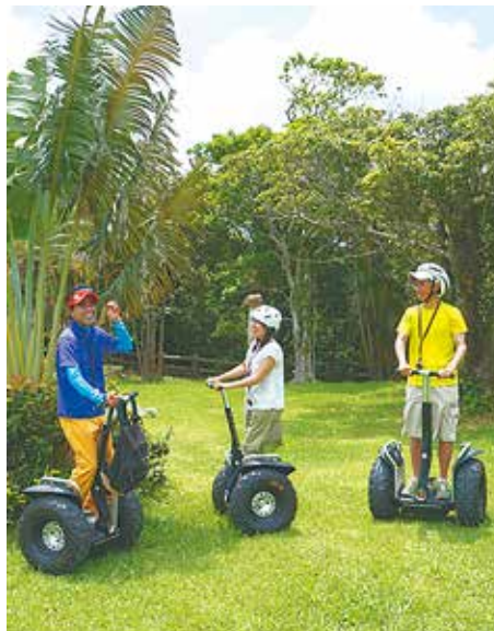
セグウェイツアーの対象は16歳以上。坂道も快適に走行！